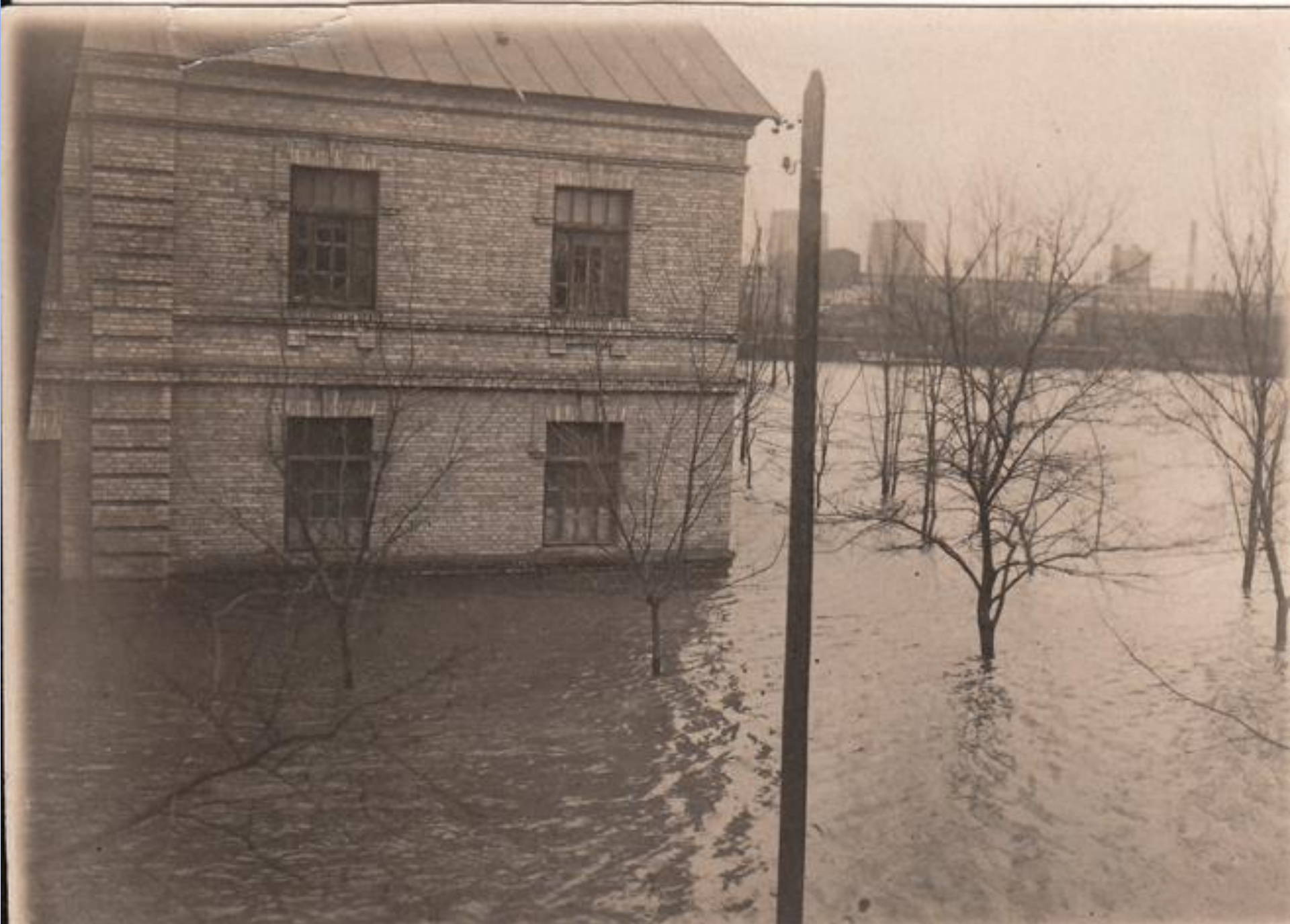
Наводнение Старого города 30. годы XX в.