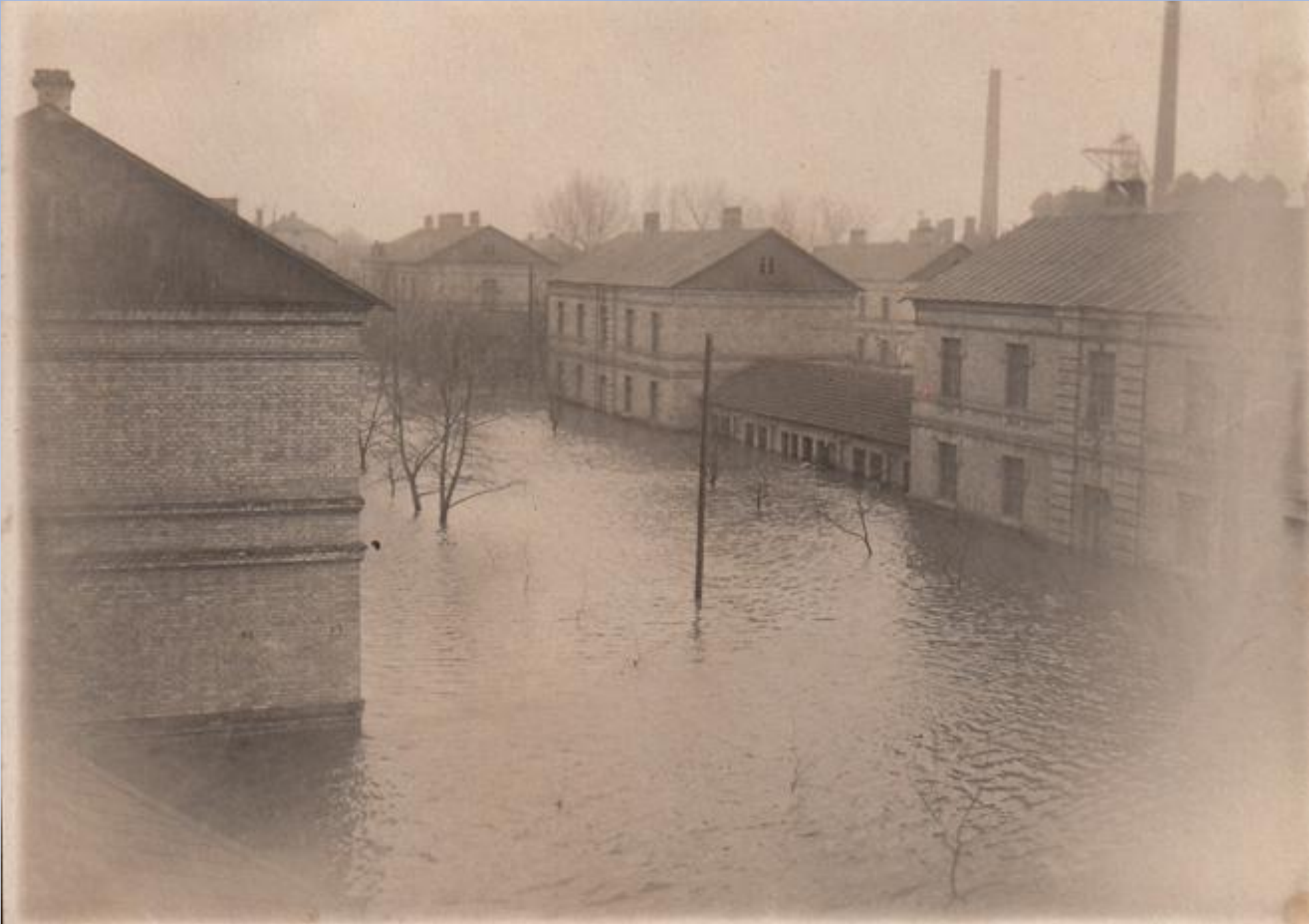
Наводнение Старого города 30. годы XX в.