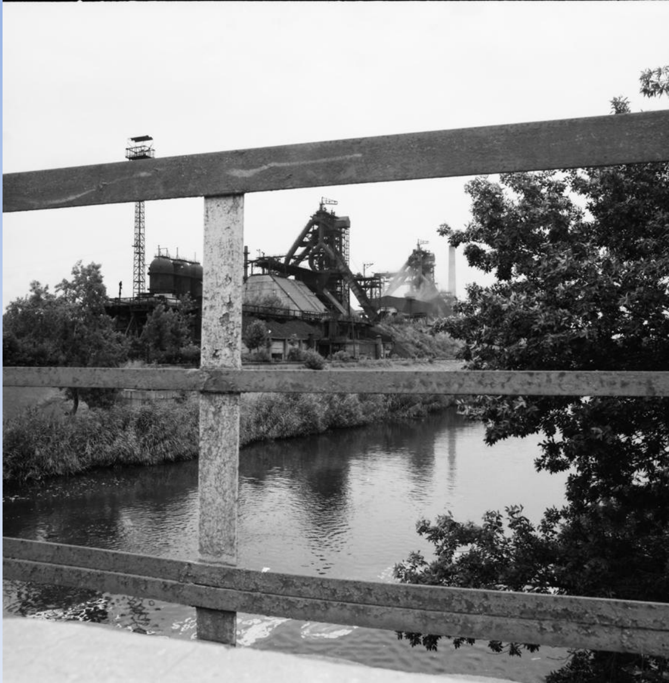
Река Казённый Торéц