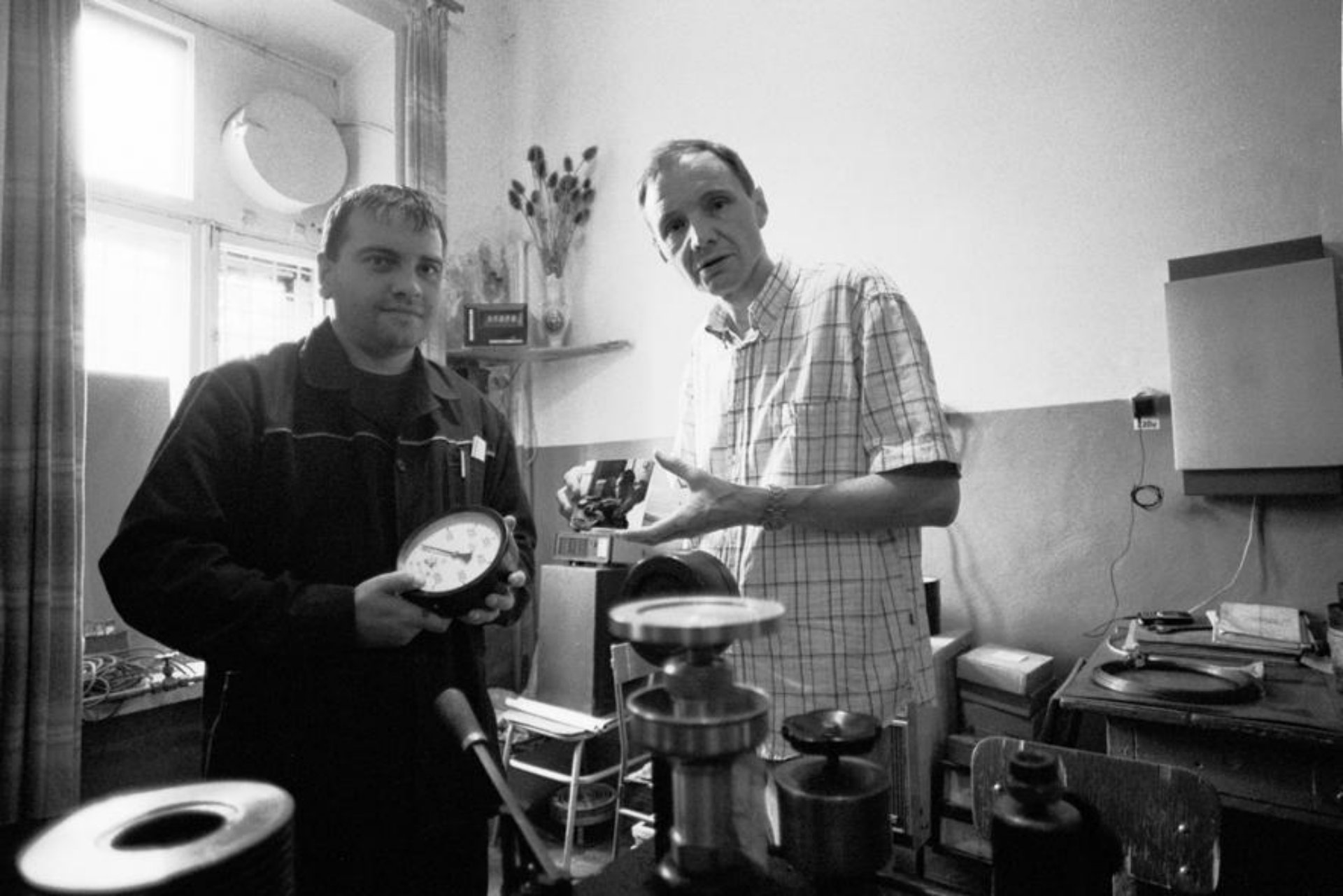
Встреча в мастерской с прецизионным механиком, работающим здесь.

Краматорск, июль 2008 г.